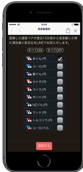
急変動通知設定画面